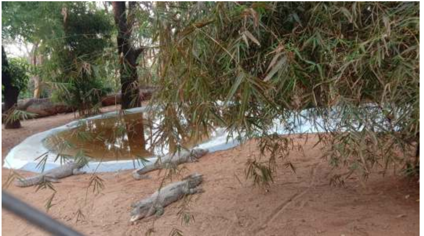
Zoo Park in Horsley Hills